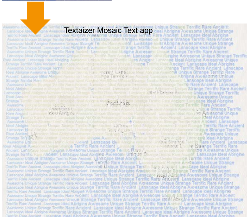
Εφαρμογή Textaizer Mosaic Text