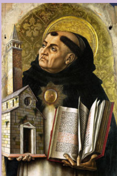
Zdroj: „Saint Thomas Aquinas“ by Carlo Crivelli, 15th Century

http://commons.wikimedia.org/wiki/File:Harvester.jpg (Public Domain)