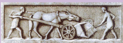
"Relief in the city of Trier"

Rozdělte studenty do čtyř skupin a každé z nich přiřadte obrázek, na kterém je zachycena jejich postava (zemědělec ze starého Říma, středověký filosof, současný teenager z afrického kmene, současný teenager z euro-amerického prostředí).